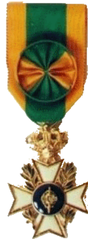
Médaille du Mérite Officier

Grand Modèle 60,00 € Petit Modèle 35,00 € Boutonnière Rosette 18,00 €