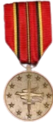
Médaille Sociétaire Missions à l'Étranger

Grand Modèle 30,00 € Petit Modèle 20,00 € Fixe revers 5,00 €