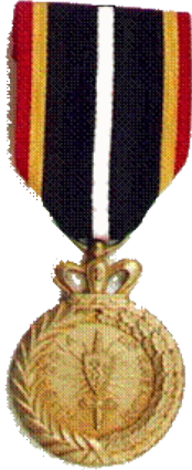
Médaille Sociétaire U.N.A.O.

Grand Modèle 30,00 € Petit Modèle 20,00 € Fixe revers 5,00 €