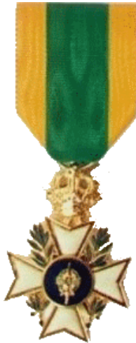
Médaille du Mérite Chevalier

Grand Modèle 40,00 € Petit Modèle 24,00 € Fixe revers 5,00 €