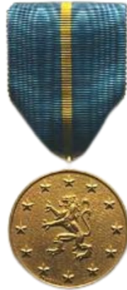
Médaille Sociétaire F.B.A

Grand Modèle 30,00 € Petit Modèle 20,00 € Fixe revers 5,00 €