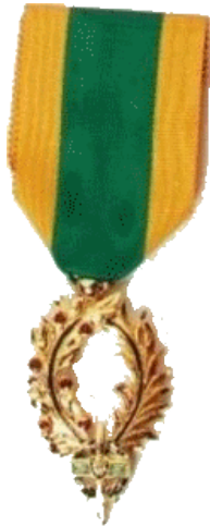
Médaille du Mérite GPO

Grand Modèle 32,00 € Petit Modèle 22,00 € Fixe revers 5,00 €