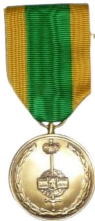
Médaille de Fidélité

Grand Module avec barrette 20 ans 32,00 € Barrette à partir de 25 ans 6,00 €