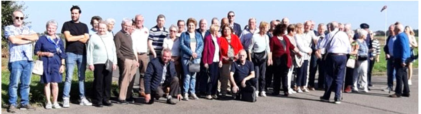
Groepsfoto aan de vliegveld te Bevekom

Naast de vaderlandslievende plechtigheden was er ook aandacht voor een educatieve uitstap . Op zaterdag 16 september werd er een rondrit georganiseerd door het mooie noordoostelijke deel van het Hageland. Het bezoek aan de militaire luchtmachtbasis van Bevekom ging onder grote belangstelling door op dinsdag 10 oktober en mag succesvol worden genoemd !