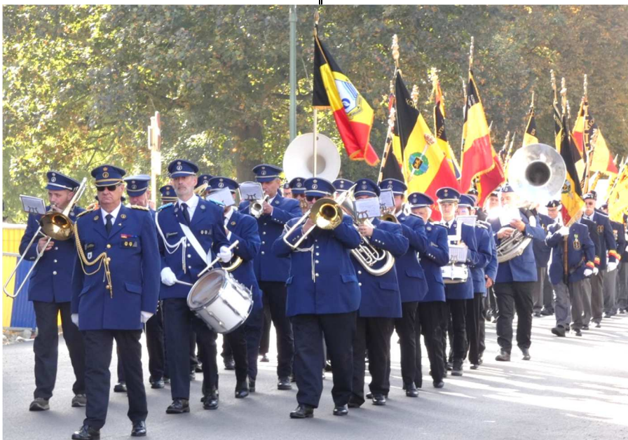
La Musique de la Police de Bruxelles

Nous prenons le bus pour nous rendre Place de la Liberté en vue de la dernière partie de la cérémonie.